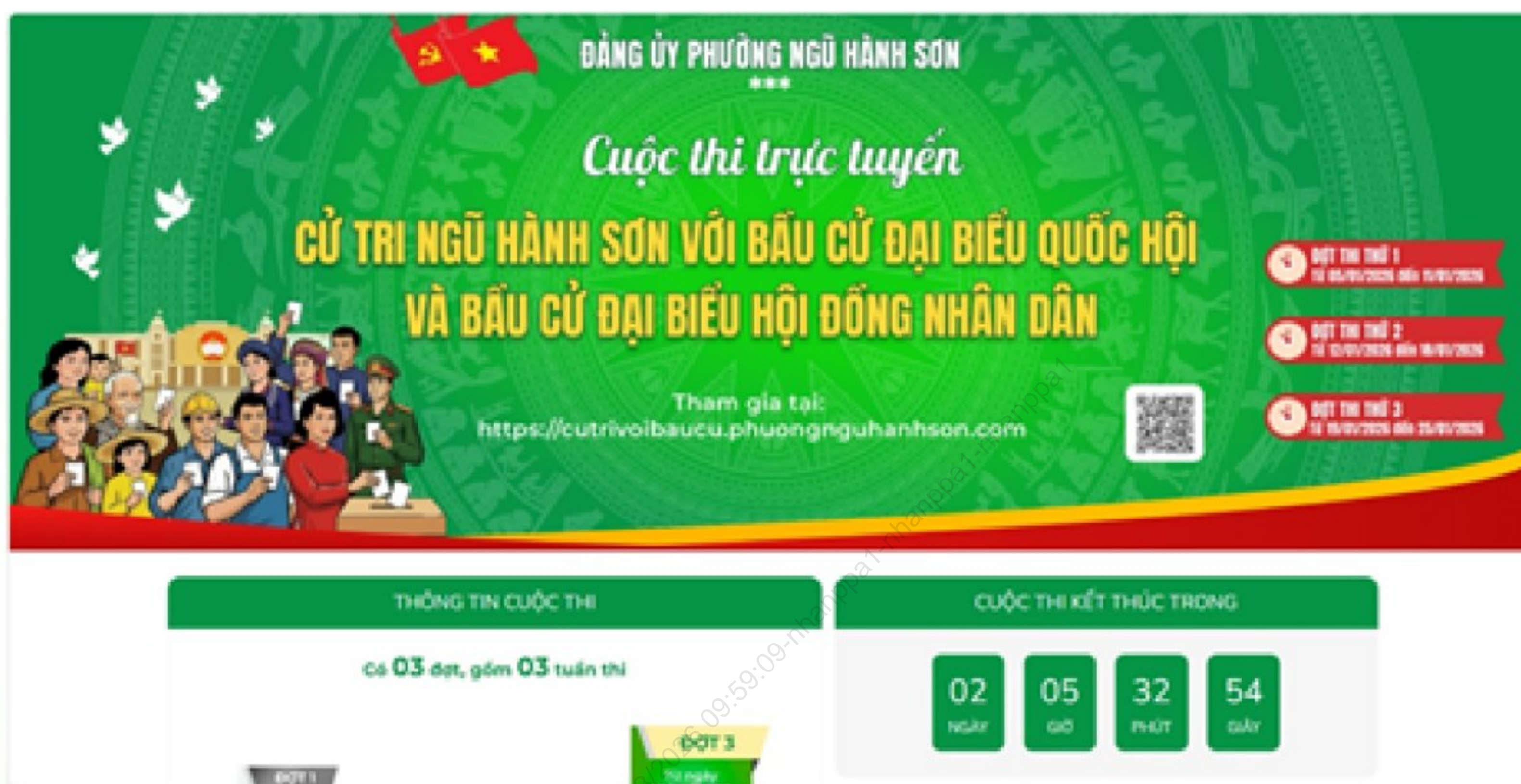
Đảng ủy phường Ngũ Hành Sơn tổ chức Cuộc thi trực tuyến "Cử tri Ngũ Hành Sơn với bầu cử đại biểu Quốc hội và bầu cử đại biểu Hội đồng nhân dân"

Đặc biệt, Đảng ủy phường Ngũ Hành Sơn tổ chức Cuộc thi trực tuyến "Cử tri Ngũ Hành Sơn với bầu cử đại biểu Quốc hội và bầu cử đại biểu Hội đồng nhân dân". Cuộc thi diễn ra trong 03 tuần từ ngày 5/1 đến ngày 25/1. Nội dung tập trung tuyên truyền: Chỉ thị số 46-CT/TW ngày