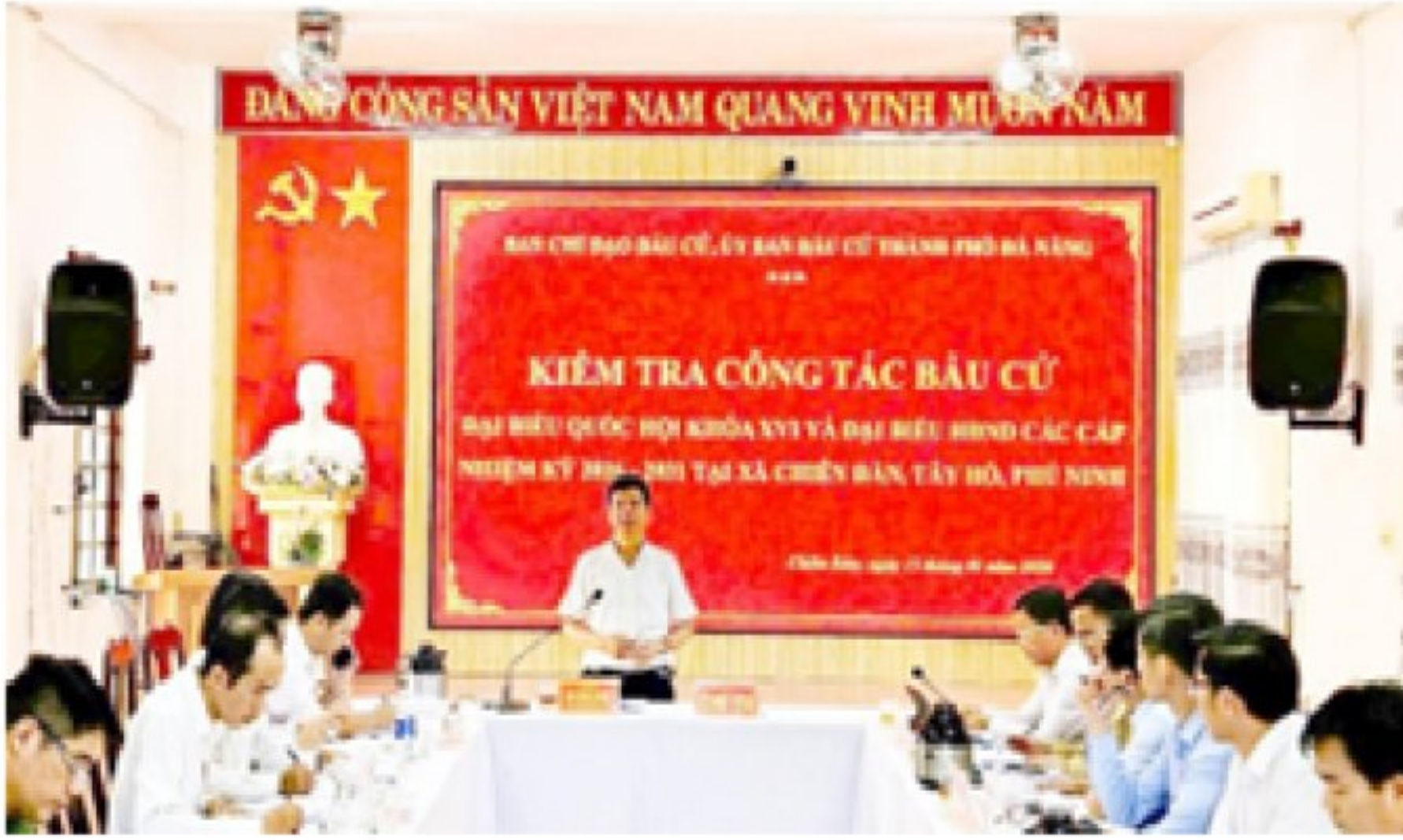
Kiểm tra công tác bầu cử tại các xã Tây Hồ, Chiên Đàn và Phú Ninh