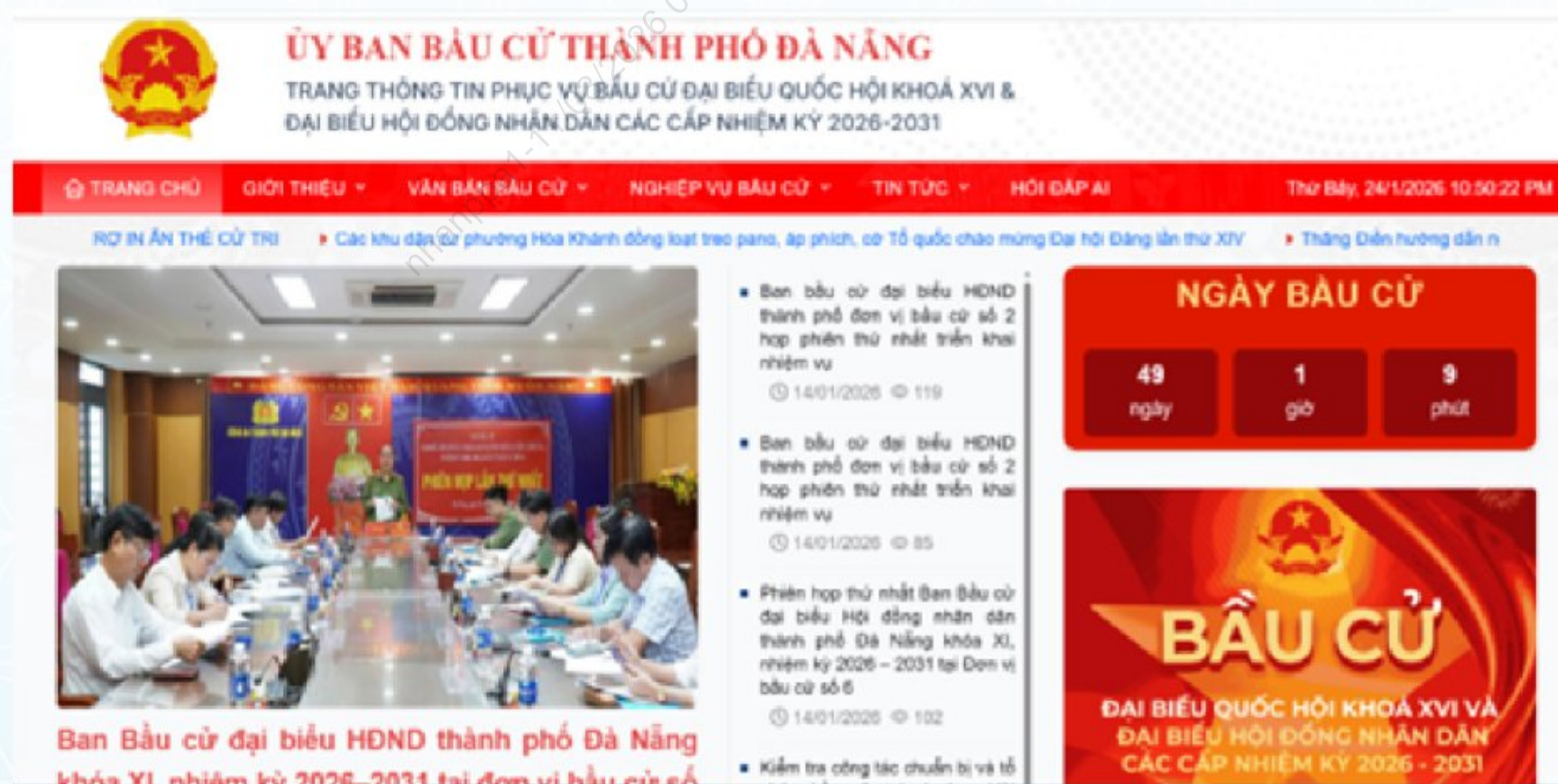
Trang thông tin điện tử của Ủy ban bầu cử thành phố Đà Nẵng

Trong thời gian tới, thành phố Đà Nẵng tiếp tục tập trung thành lập đầy đủ các Tổ bầu cử đúng thời hạn; tổ chức Hội nghị hiệp thương lần thứ hai, thứ ba bảo đảm chặt chẽ, dân chủ, đúng quy định; tăng cường kiểm tra, giám sát; đẩy mạnh tuyên truyền chiều sâu, hướng về cơ sở và cử tri.