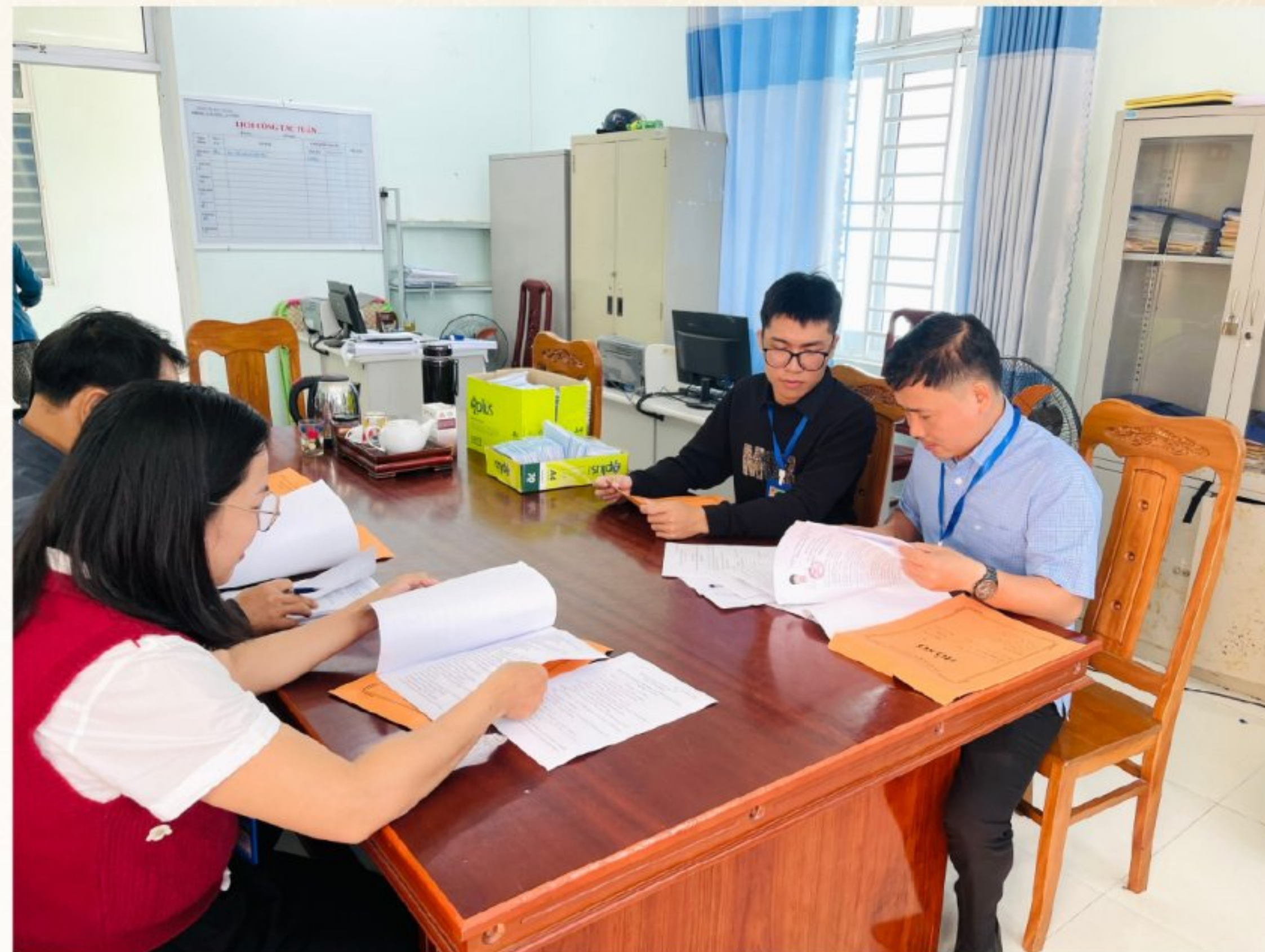
Ứng cử viên nộp hồ sơ ứng cử

Xác định công tác tuyên truyền, phổ biến, giáo dục pháp luật về bầu cử là nhiệm vụ trọng tâm, xã Duy Nghĩa đã và đang đẩy mạnh tuyên truyền bằng nhiều hình thức đa dạng, phong phú, phù hợp với điều kiện thực tế của địa phương. Nội dung tuyên truyền tập trung làm rõ ý nghĩa, tầm quan trọng của cuộc bầu cử; các quy định của Luật Bầu cử; quyền và nghĩa vụ của cử tri; tiêu chuẩn đại biểu Quốc hội và đại biểu Hội đồng nhân dân các cấp; các mốc thời gian quan trọng của cuộc bầu cử, trọng tâm là ngày bầu cử 15/3/2026.