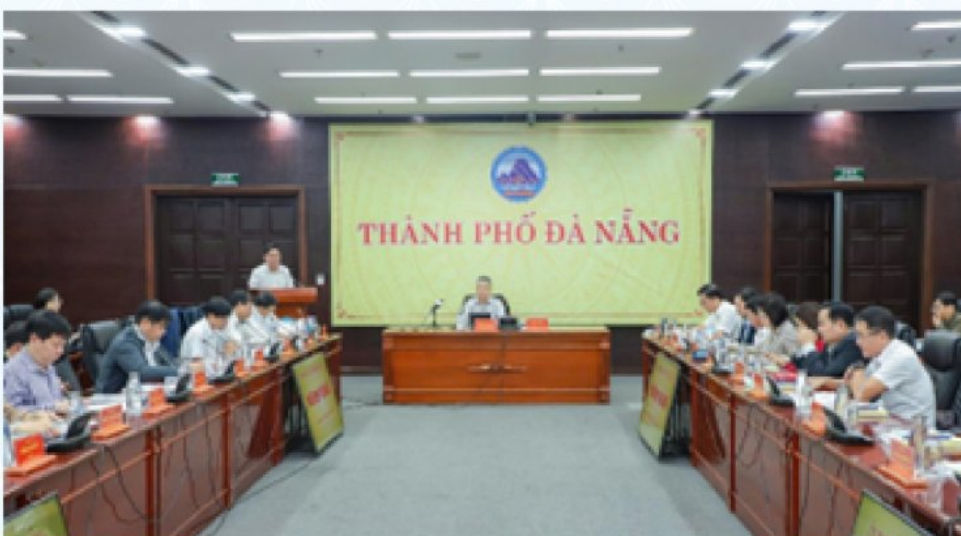
Quang cảnh phiên họp thứ nhất của Ủy ban bầu cử thành phố nhằm triển khai toàn diện công tác chuẩn bị cho cuộc bầu cử đại biểu Quốc hội khóa XVI và đại biểu HĐND các cấp nhiệm kỳ 2026 - 2031