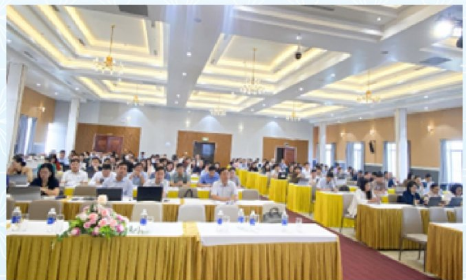
Quang cảnh Hội nghị giao ban nghiệp vụ công tác bầu cử