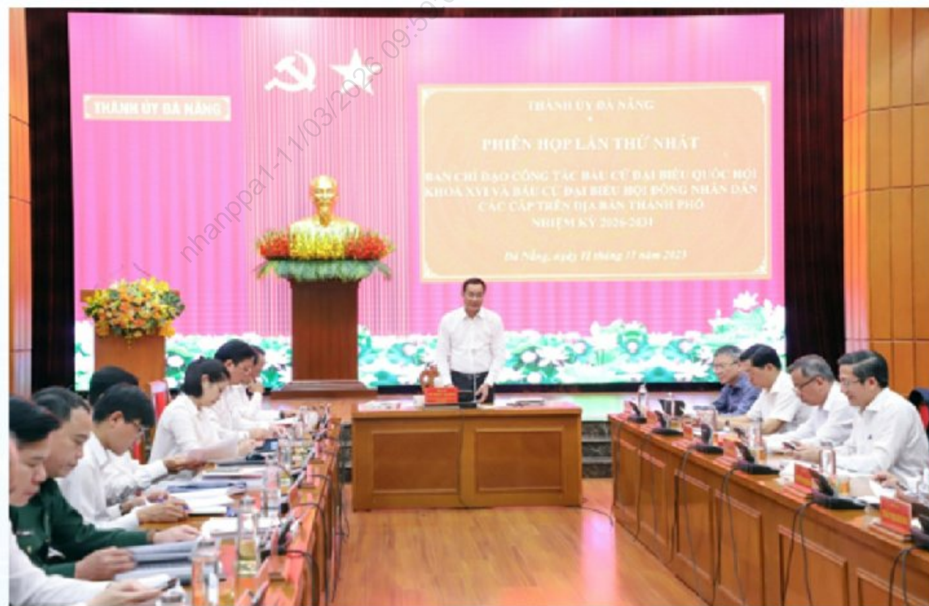
Quang cảnh phiên họp thứ nhất của Ban Chỉ đạo bầu cử thành phố Đà Nẵng

Nhận thức rõ ý nghĩa đó, thành phố Đà Nẵng đã xác định công tác chuẩn bị bầu cử là nhiệm vụ chính trị trọng tâm, được triển khai từ sớm, từ xa, đồng bộ và đúng quy định pháp luật, với sự vào cuộc của cả hệ thống chính trị.