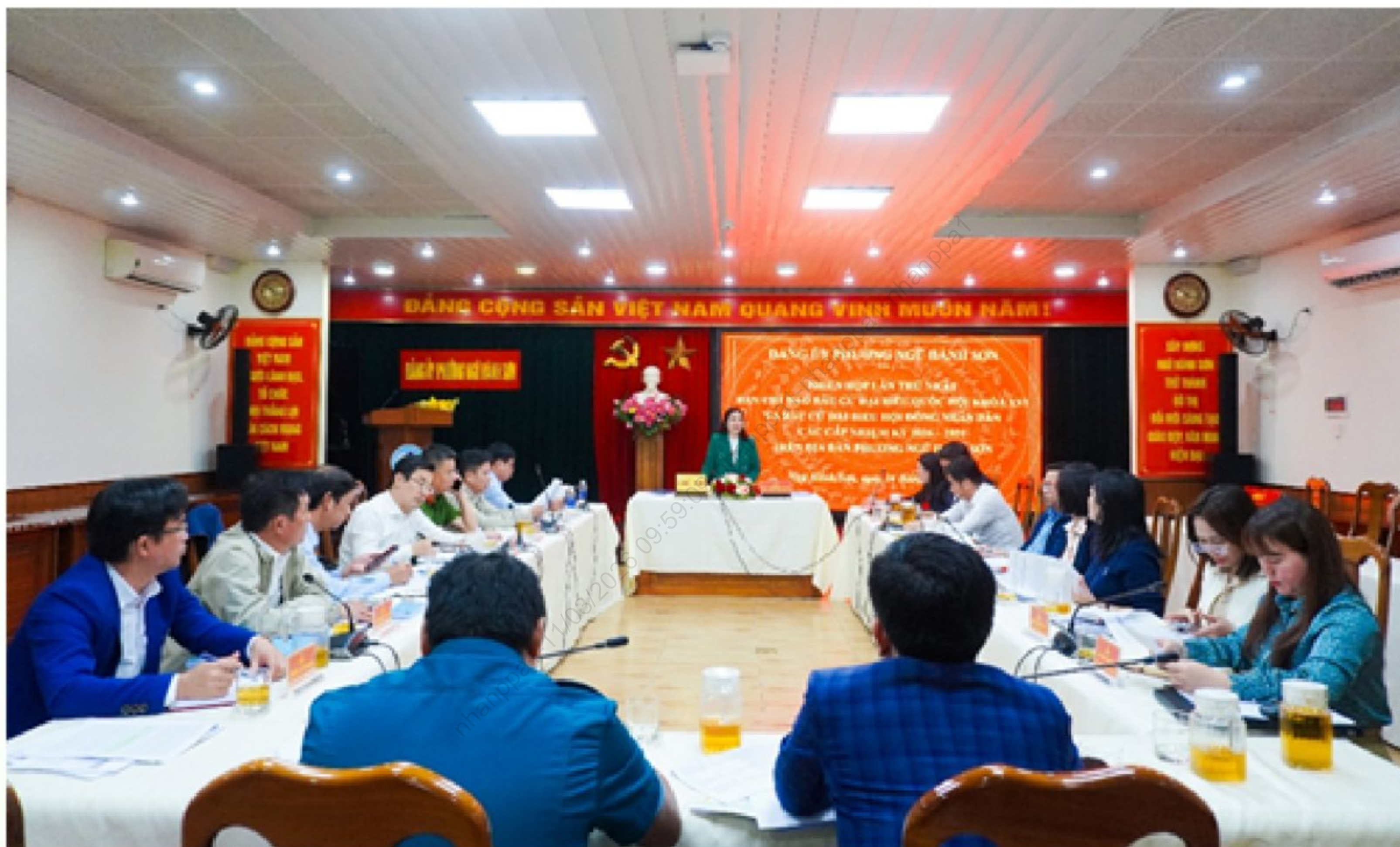
Ban Chỉ đạo Bầu cử đại biểu Quốc hội khóa XVI và đại biểu HĐND các cấp phường Ngũ Hành Sơn họp triển khai nhiệm vụ

Thực hiện các văn bản chỉ đạo của cấp trên về cuộc bầu cử đại biểu Quốc hội khóa XVI và đại biểu HĐND các cấp, nhiệm kỳ 2026 - 2031, phường Ngũ Hành Sơn đang triển khai đồng bộ các nhiệm vụ theo đúng quy định của Luật Bầu cử. Với quyết tâm cao và sự vào cuộc của cả hệ thống chính trị, công tác chuẩn bị cho ngày hội lớn của toàn dân được thực hiện chu đáo, nghiêm túc, tạo nền tảng vững chắc để tổ chức thành công cuộc bầu cử trên địa bàn.