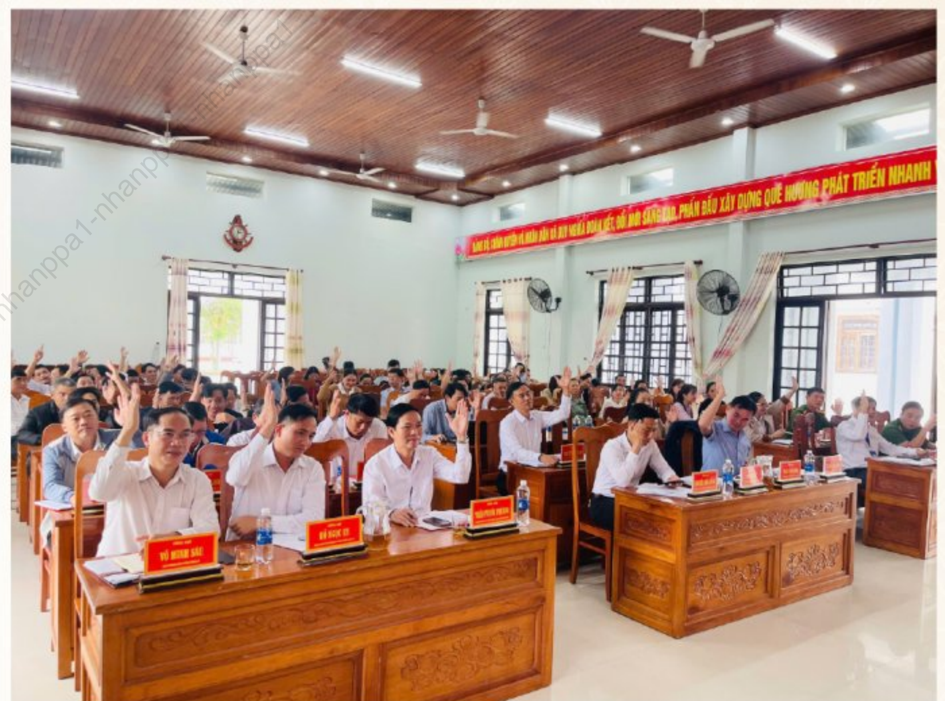
Lấy ý kiến cử tri nơi công tác đối với người ứng cử