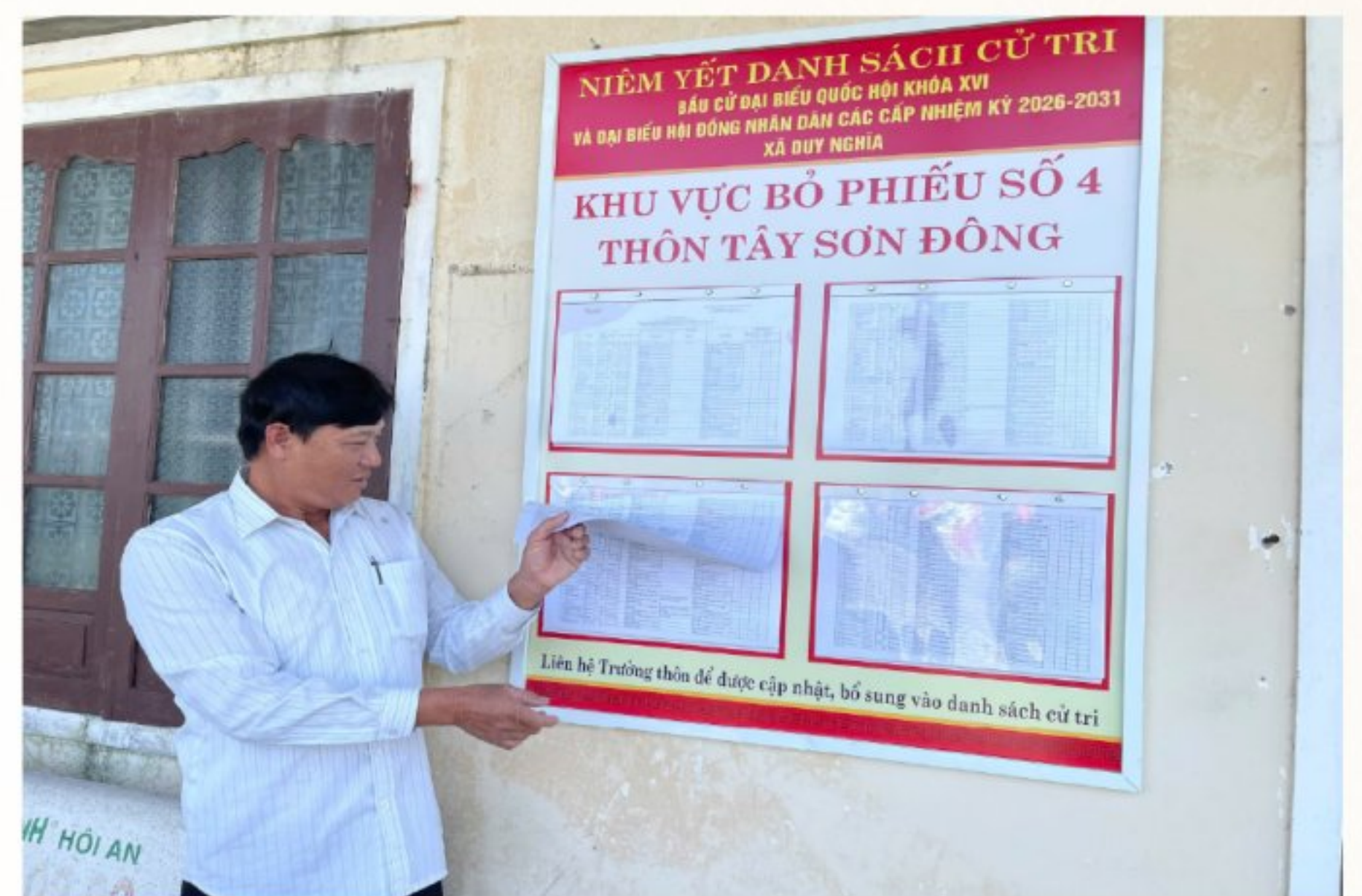
Niem yết danh sách cử tri tại các khu vực bầu cử

các hội nghị hiệp thương theo đúng trình tự, quy định của pháp luật; hướng dẫn việc giới thiệu người ứng cử, tổ chức hội nghị lấy ý kiến cử tri