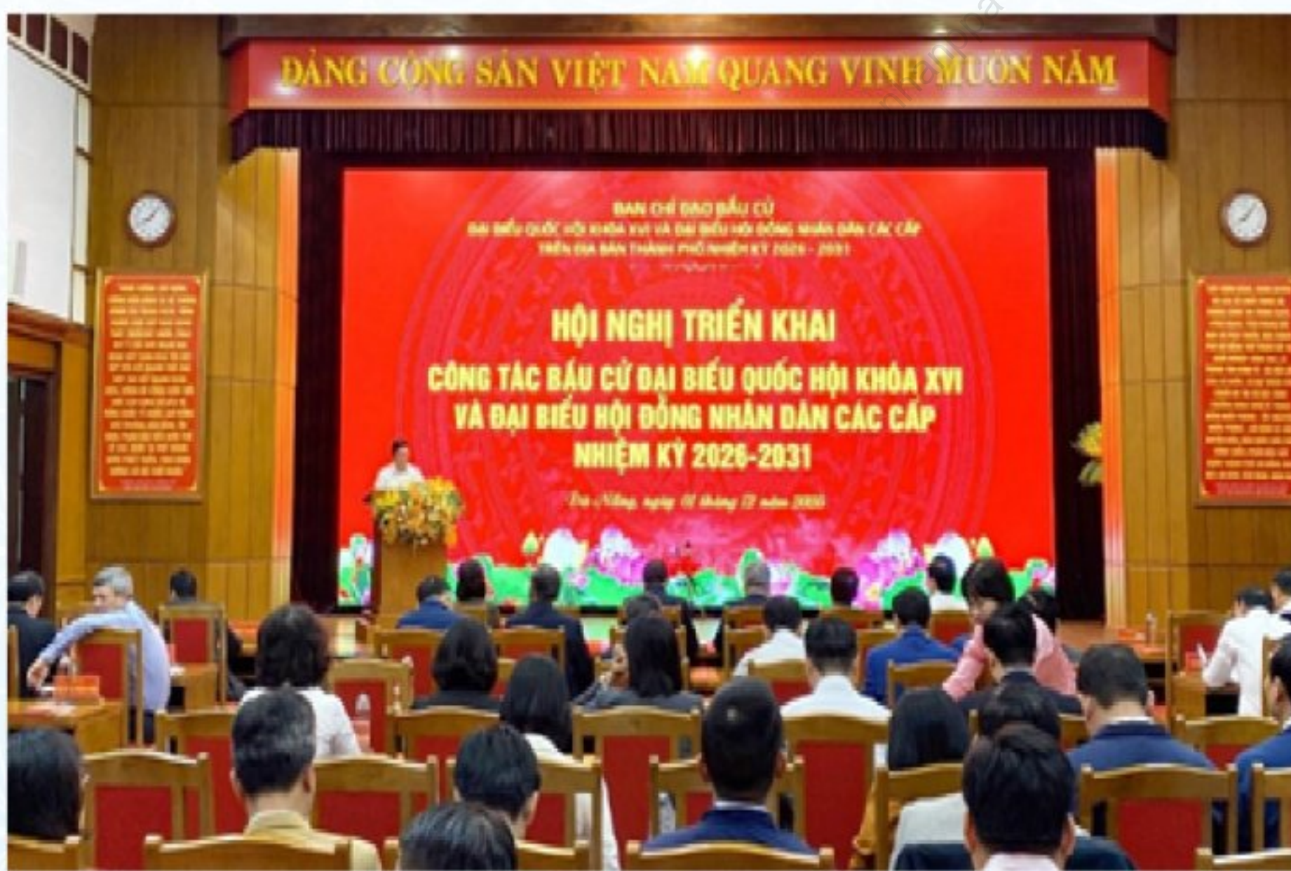
Quang cảnh Hội nghị triển khai công tác bầu cử

Cùng với công tác hướng dẫn nghiệp vụ, việc thành lập các Ban bầu cử đại biểu Quốc hội và Ban bầu cử đại biểu HĐND các cấp được triển khai đúng mốc thời gian luật định, bảo đảm sự phối hợp chặt chẽ giữa Thường trực HĐND, Ủy ban Mặt trận Tổ quốc Việt Nam và UBND các cấp.