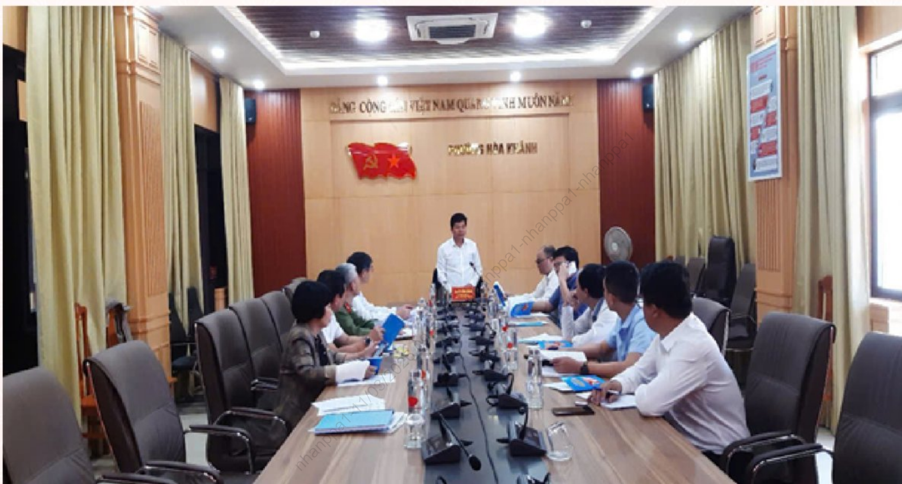
Đồng chí Võ Công Chánh, Ủy viên Ban Thường vụ Thành ủy Trưởng Ban Nội chính Thành ủy, Ủy viên Ban Chỉ đạo bầu cử thành phố, Ủy viên Ủy ban bầu cử thành phố chủ trì phiên họp

Vào chiều 16/01/2026, tại trụ sở UBND phường Hòa Khánh, Ban bầu cử đại biểu HĐND thành phố khóa XI tại Đơn vị bầu cử số 4 thành phố đã tiến hành phiên họp lần thứ nhất để triển khai các nhiệm vụ công tác bầu cử. Đồng chí Võ Công Chánh, Ủy viên Ban Thường vụ Thành ủy, Trưởng Ban Nội chính Thành ủy, Trưởng Ban bầu cử đại biểu HĐND thành phố khóa XI, nhiệm kỳ 2026 - 2031 tại