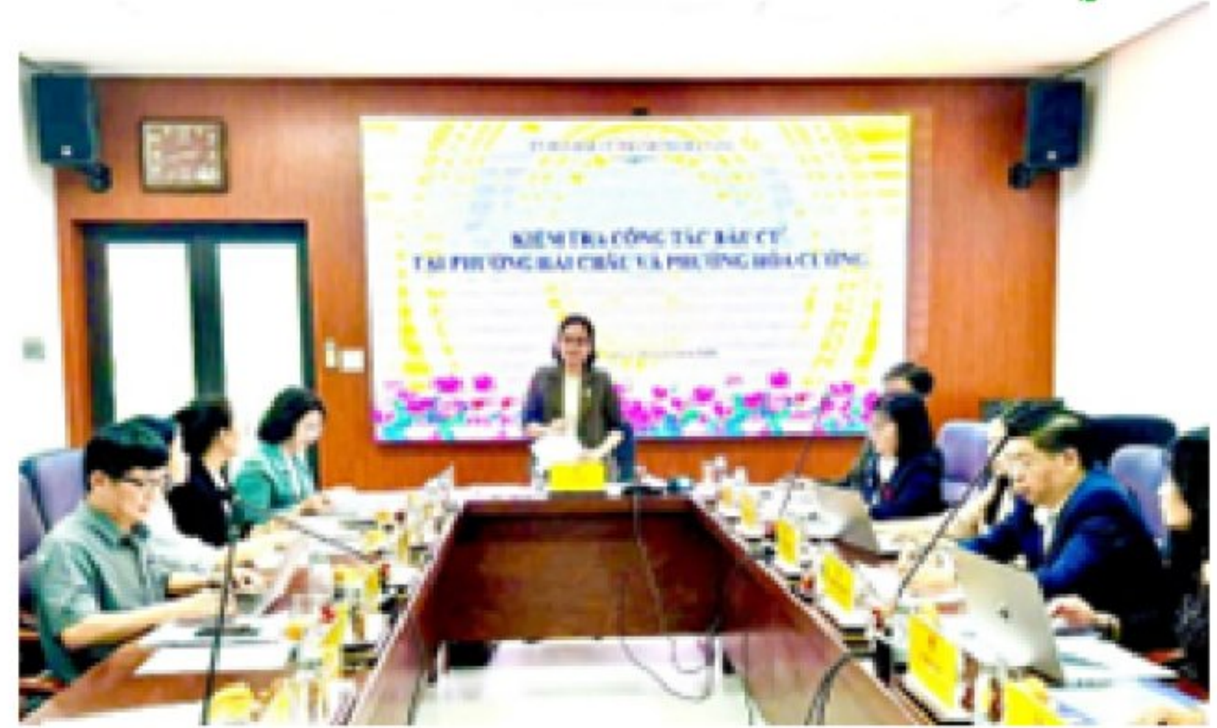
Kiểm tra công tác chuẩn bị và tổ chức bầu cử tại phường Hải Châu và Hòa Cường