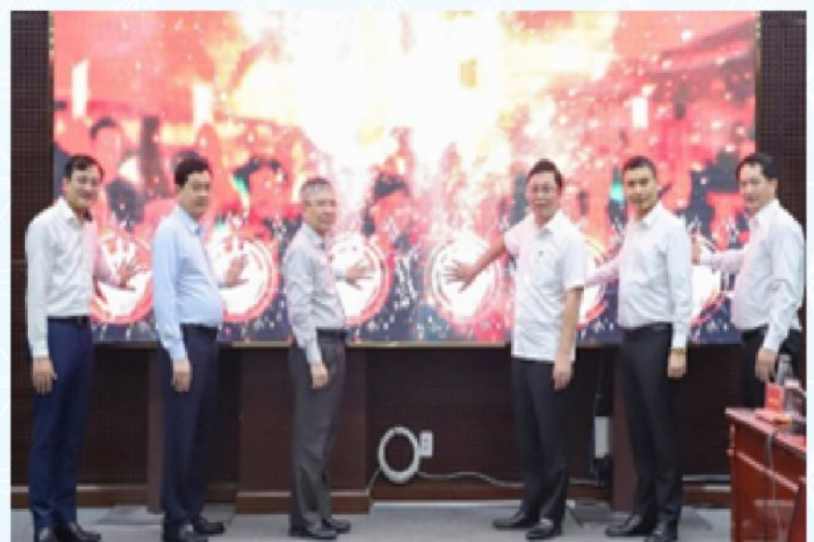
Lãnh đạo thành phố thực hiện nghi thức ra mắt Trang thông tin điện tử của Ủy ban bầu cử thành phố Đà Nẵng