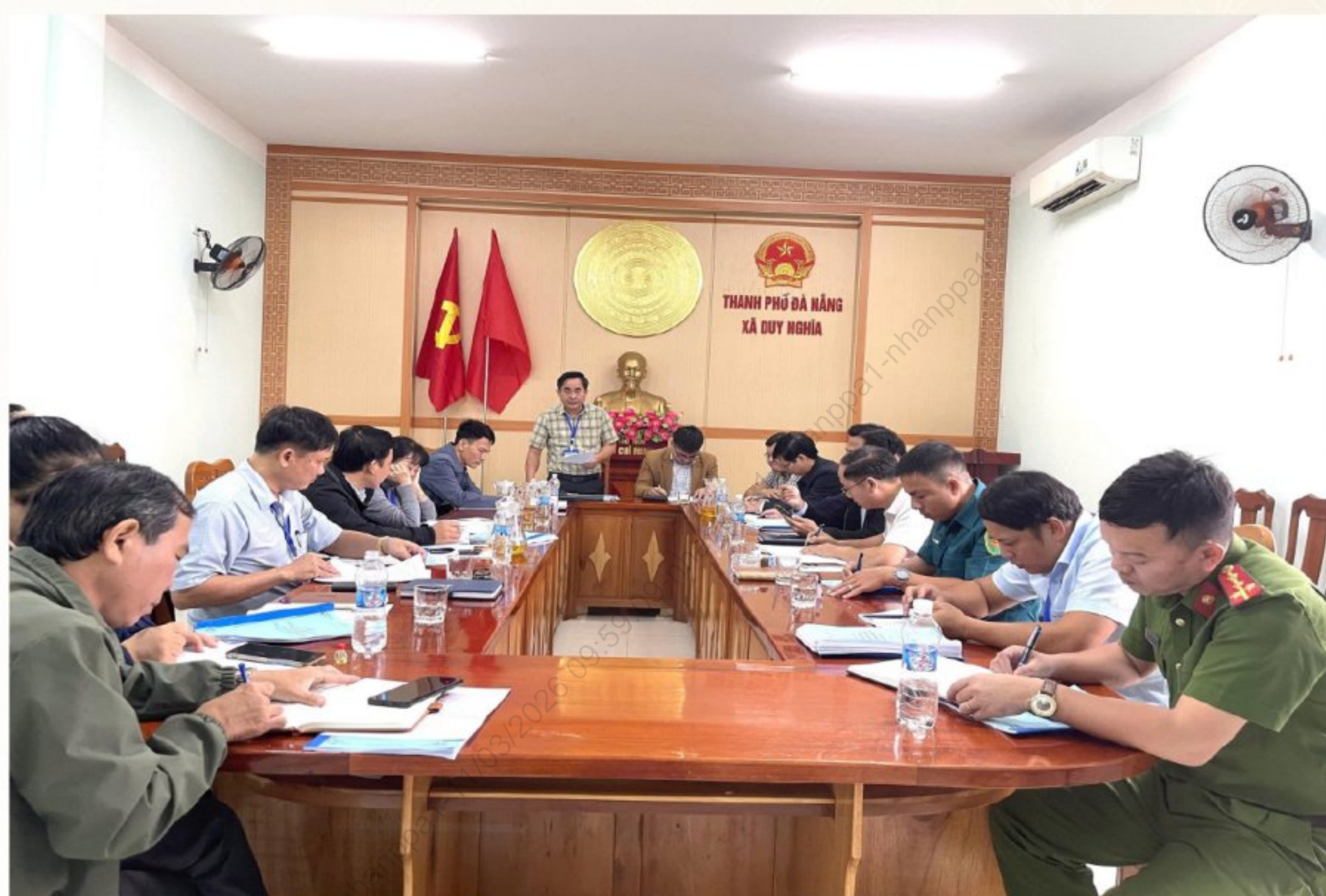
Họp Ban bầu cử xã

Cuộc bầu cử đại biểu Quốc hội khóa XVI và đại biểu Hội đồng nhân dân các cấp nhiệm kỳ 2026 – 2031 là sự kiện chính trị trọng đại của đất nước, có ý nghĩa đặc biệt quan trọng trong đời sống chính trị – xã hội, thể hiện quyền làm chủ của Nhân dân, góp phần xây dựng Nhà nước pháp quyền xã hội chủ nghĩa Việt Nam của Nhân dân, do Nhân dân và vì Nhân dân.