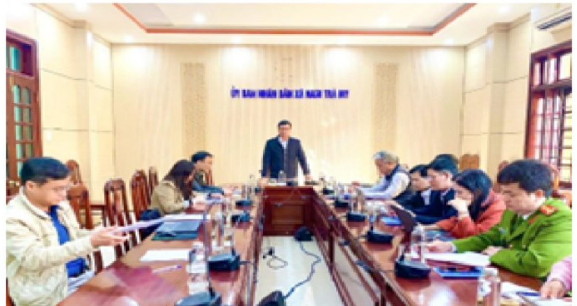
Quang cảnh phiên họp thứ nhất tại các đơn vị bầu cử