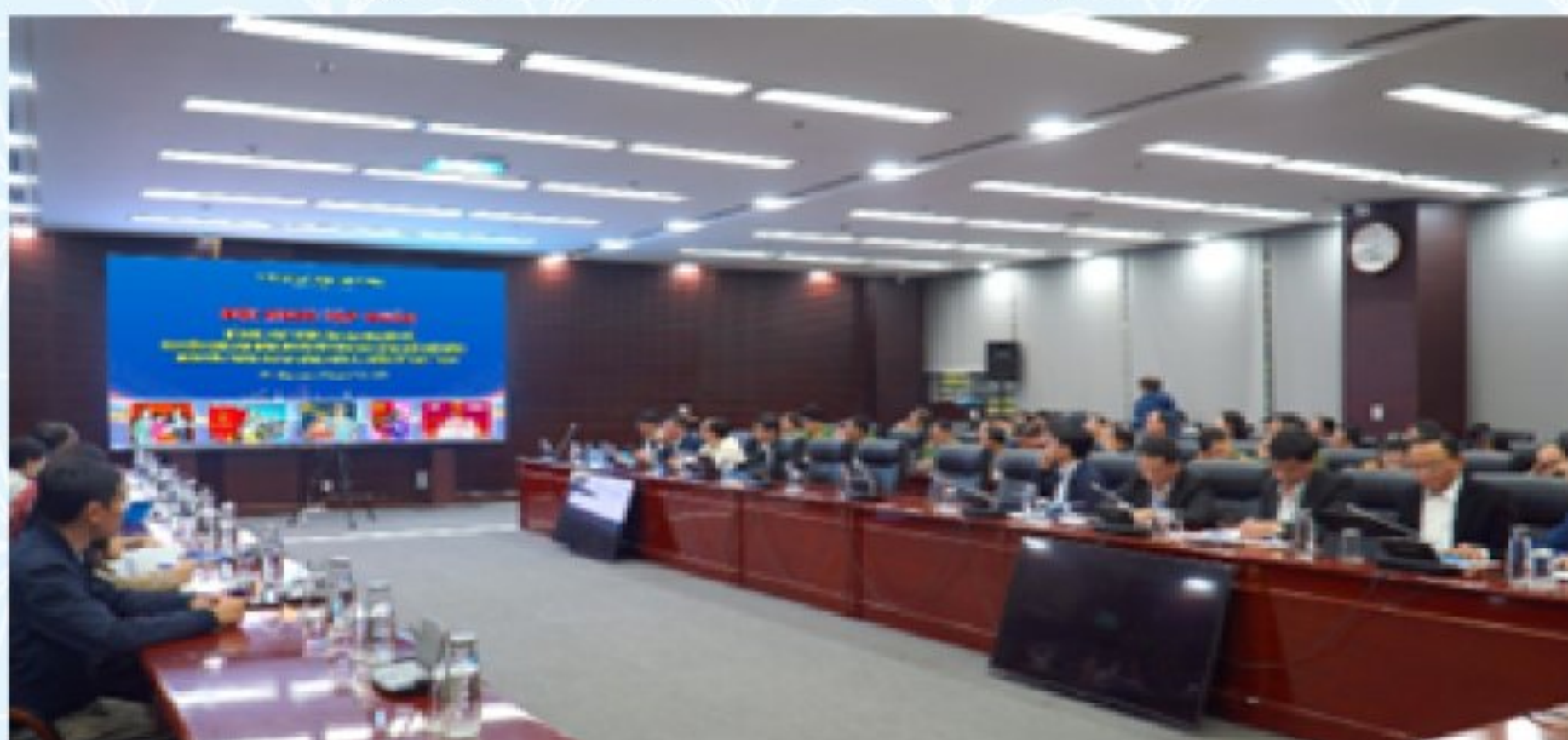
Quang cảnh Hội nghị tập huấn về hoạt động của Ban bầu cử