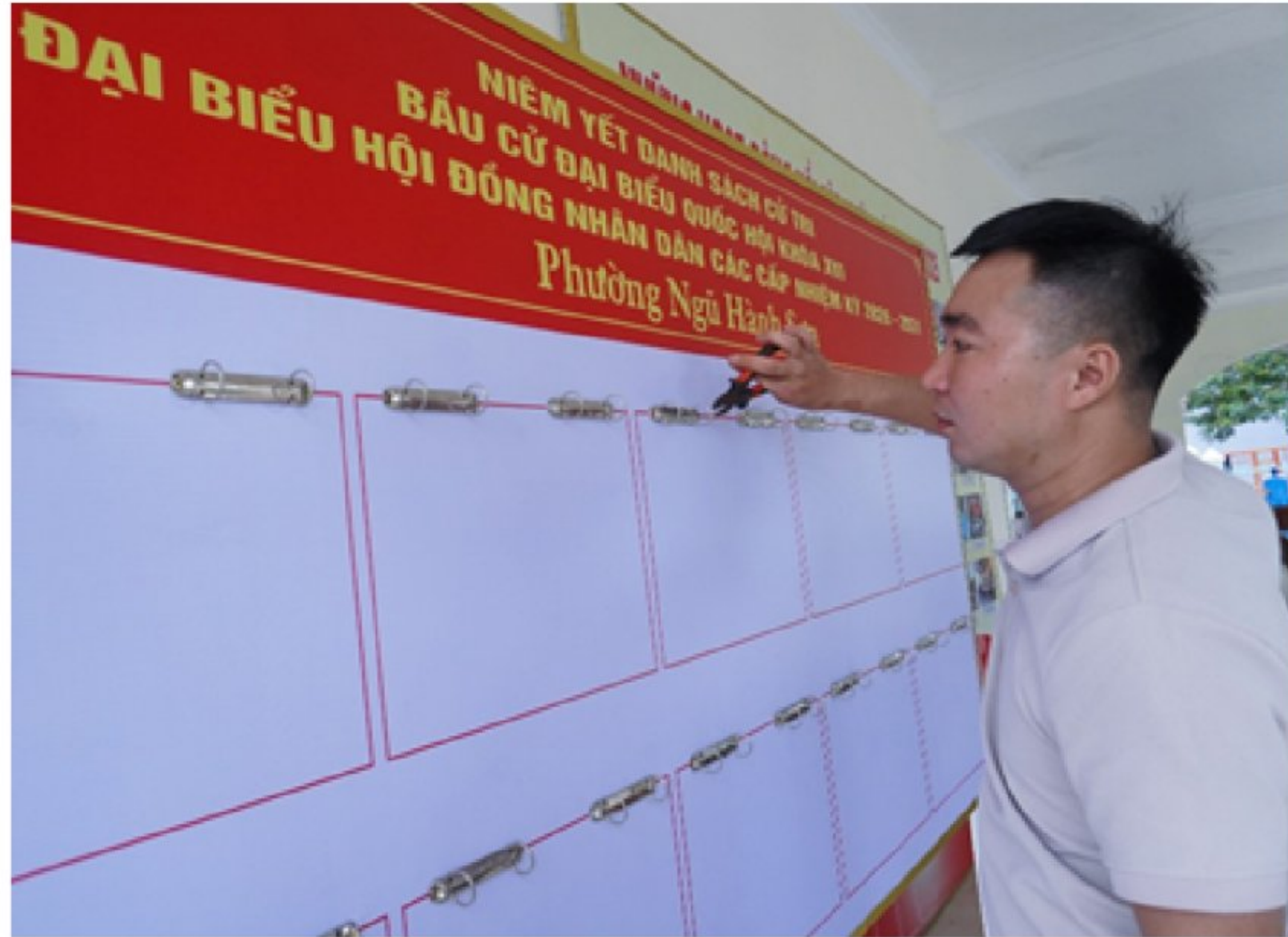
Viên chức Trung tâm Dịch vụ sự nghiệp công phường Ngũ Hành Sơn lắp đặt các bảng niêm yết danh sách cử tri

nhận thức của cán bộ, đảng viên và Nhân dân về mục đích, ý nghĩa, tầm quan trọng của cuộc bầu cử được nâng cao, tạo nền tảng vững chắc để tổ chức thành công ngày hội bầu cử trên địa bàn.