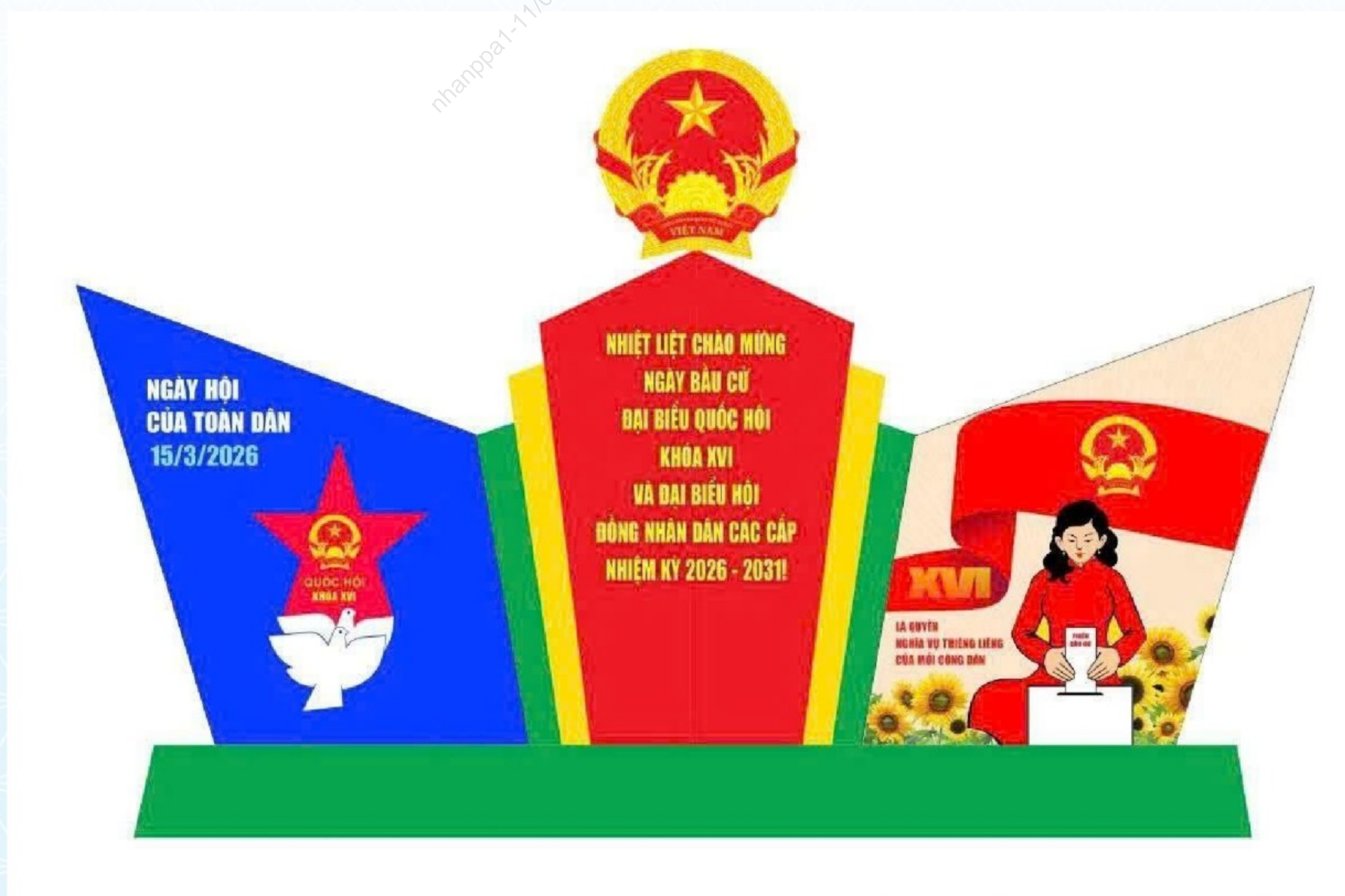
Mô hình biểu trưng tuyên truyền bầu cử

Hoạt động văn hóa văn nghệ được tổ chức từ trung tâm thành phố đến xã, phường với hơn 30 chương trình như: 02 chương trình nghệ thuật chào mừng (12/3/2026 tại Quảng trường 29/3, phường Hoà Cường và 14/3/2026 tại Quảng trường 24/3, phường Bàn Thạch); 04 chương trình nghệ thuật phục vụ nhân dân